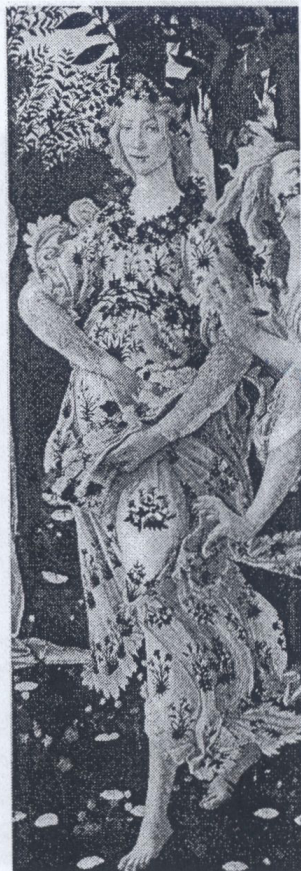
Sandro Botticelli: Simonetta Vespucci als Primavera, Ausschnitt aus „La Primavera“ („Der Frühling“)

Noch lange nach ihrem Tod gab Piero di Cosima einem Idealbild ihren Namen, das zugleich die Cleopatra mit der Schlange um den Hals darstellt. Deren Geschick wird mit dem frühen Tod von Simonetta Vespucci verglichen.