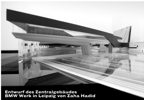
Entwurf des Zentralgebäudes BMW Werk in Leipzig von Zaha Hadid

Wir freuen uns auf das Werk von Zaha Hadid in Leipzig und wünschen den Bürgern der Stadt und den Besuchern von »Metapolis« viel Freude.