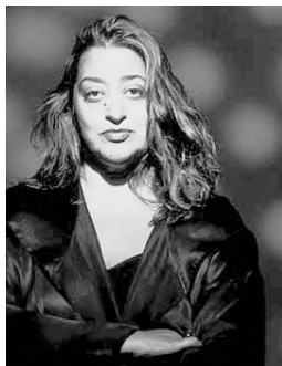
Zaha Hadid rechts außen: Feuerwehrhaus auf dem Vitra-Gelände, Weil am Rhein

Sie hat zudem Möbel und Inneneinrichtungen entwickelt, so für das Moonsoon-Restaurant in Sapporo und den Musik-Video-Pavillon in Groningen (beide 1990) und »Master's Section« im Palazzo Grassi auf der Biennale von Venedig (1996). Ihre Gemälde und Zeichnungen sind immer ein wichtiges Medium bei der Entwurfsarbeit gewesen und in ständigen Sammlungen wie in großen Retrospektiven zu sehen. Das Bühnenwerk »Metapolis«, das sie mit Frédéric Flamand im Jahr 2000 schuf, ist ihr 972. Werk (deshalb der Untertitel »Project 972«). Im Juni 2002 wurde sie ausgewählt, das Zentralgebäude für das neue BMW Werk in Leipzig zu bauen. Das Modell ist bereits in diesem Herbst auf der Internationalen Architektur-Biennale in Venedig zum Motto »Next« präsentiert worden.